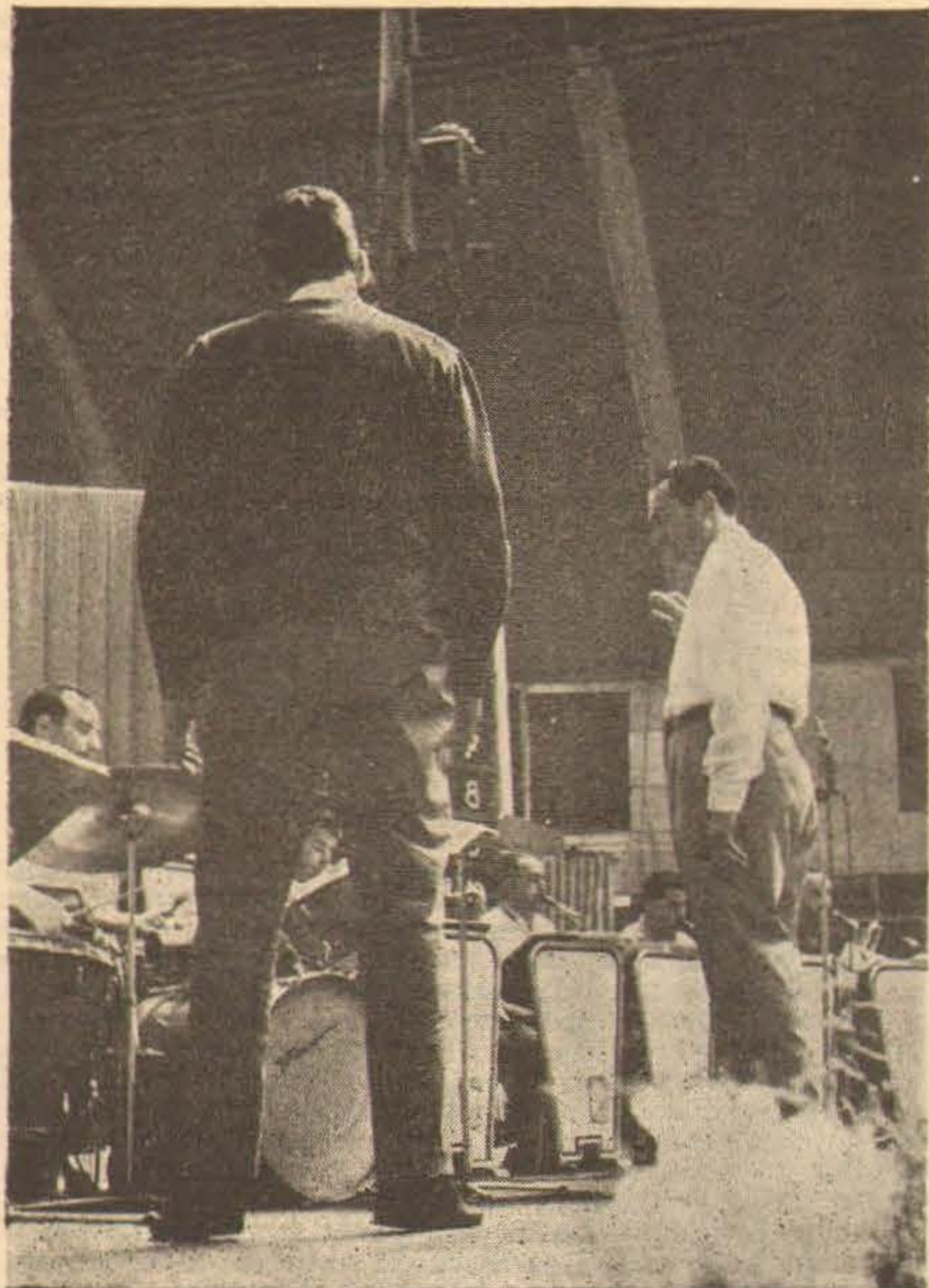
EN EL ENSAYO, ALECO SIGUE CON INTERES LA BATUTA DEL DIRECTOR