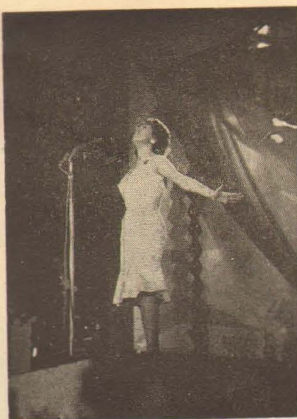
Imperio de Triana no tiene suerte en el Festival del Mediterráneo. El año pasado, la canción que interpretó, «Viento del Sur», mereció mayores honores. Este año, «Tiene duendes» y «Libre como el viento», eran canciones flojas, aptas, eso sí, para el estilo personalísimo de Imperio de Triana pero irris, excesivamente típicas para un público puesto ya en el camino del ritmo y de la sincopa. Es una pena porque Imperio de Triana debiera haber luchado con otras canciones que tal vez hayan sido eliminadas injustamente...