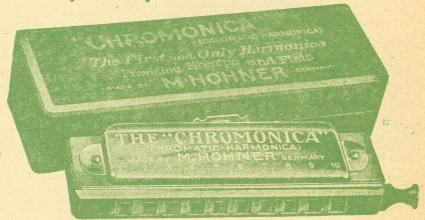
Χρωμόνικα (μέ ένα χαχίν λότω) Δρχ. 250.

ΟΙ ΤΩΝ ΕΠΑΡΧΙΩΝ ΔΥΝΑΝΤΑΙ ΝΑ ΠΑΡΑΓΓΕΛΟΥΝ ΑΠΟΣΤΕΛΛΟΝΤΕΣ ΤΟ ΑΝΤΙΤΙΜΟΝ ΔΙΑ ΤΑΧ. ΕΠΙΤΑΓΗΣ ή ΕΙΣ ΓΡΑΜΜΑΤΟΣΗΜΑ ΠΛΕΟΝ ΔΡ. 5. ΔΙΑ ΤΑΧΥΔΡΟΜΙΚΑ ΑΠΟΣΤΟΛΗ ΑΜΕΣΟΣ