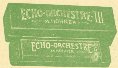
Όρχήστρα Νο 3 - Δρχ. 120