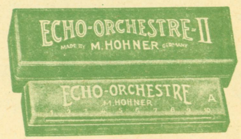
Όρχήστρα Νο 2 - Δρχ. 100