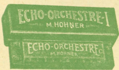
Όρχήστρα Νο 1 - Δρχ. 60

Υπάρχουν εις όλους τους τόνους και κλίμακας Ματζόρε ή Μιγόρε. Απανάχου του Κόσμου ύφισανλα πκισίκα ορχήστρα φουβαρμονικών "ΟΡΧΗΣΤΡΑ"