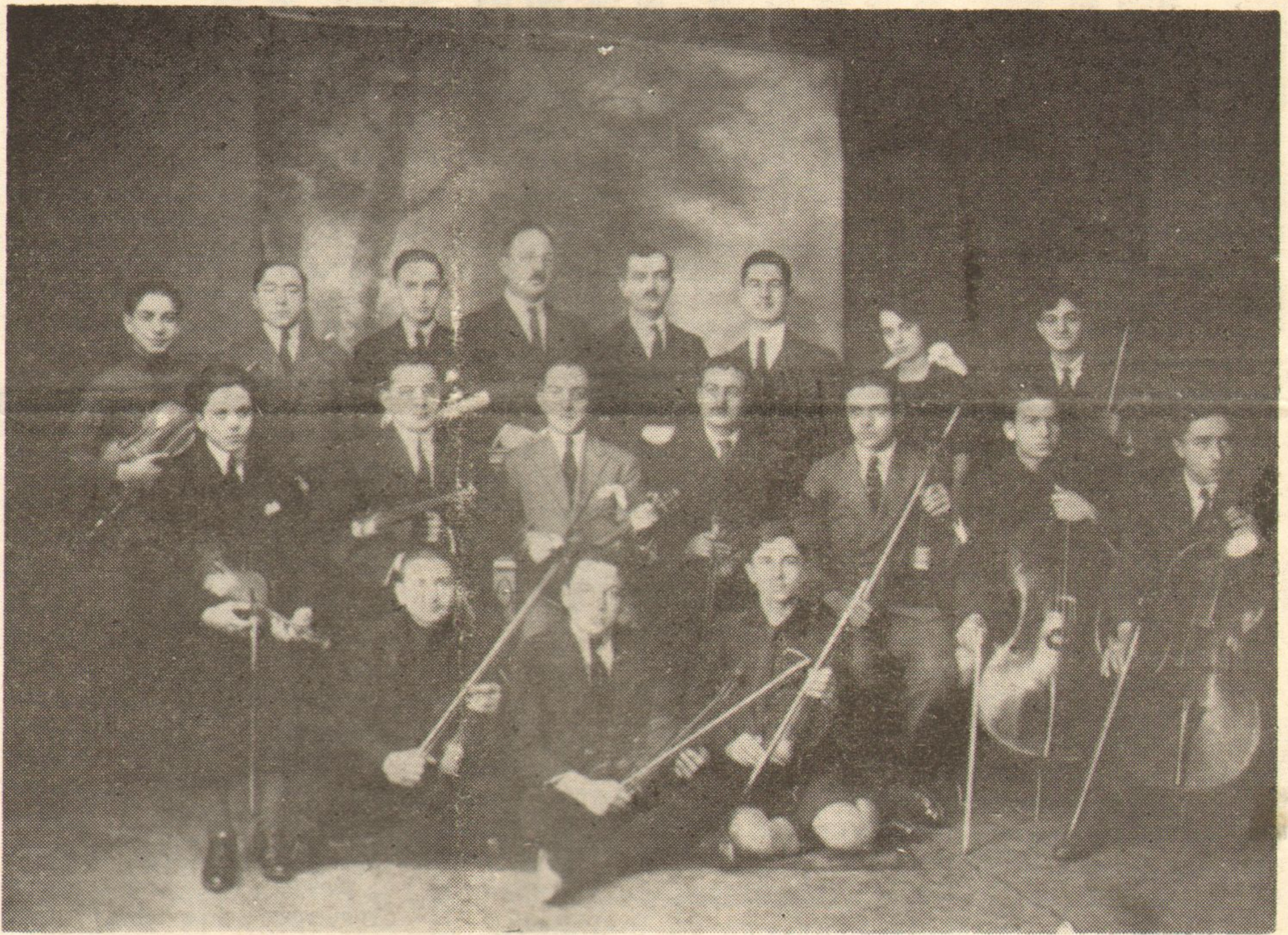
Η ΟΡΧΗΣΤΡΑ ΤΗΣ ΣΧΟΛΗΣ ΑΡΩΝΗ ΣΜΥΡΝΗ 1922