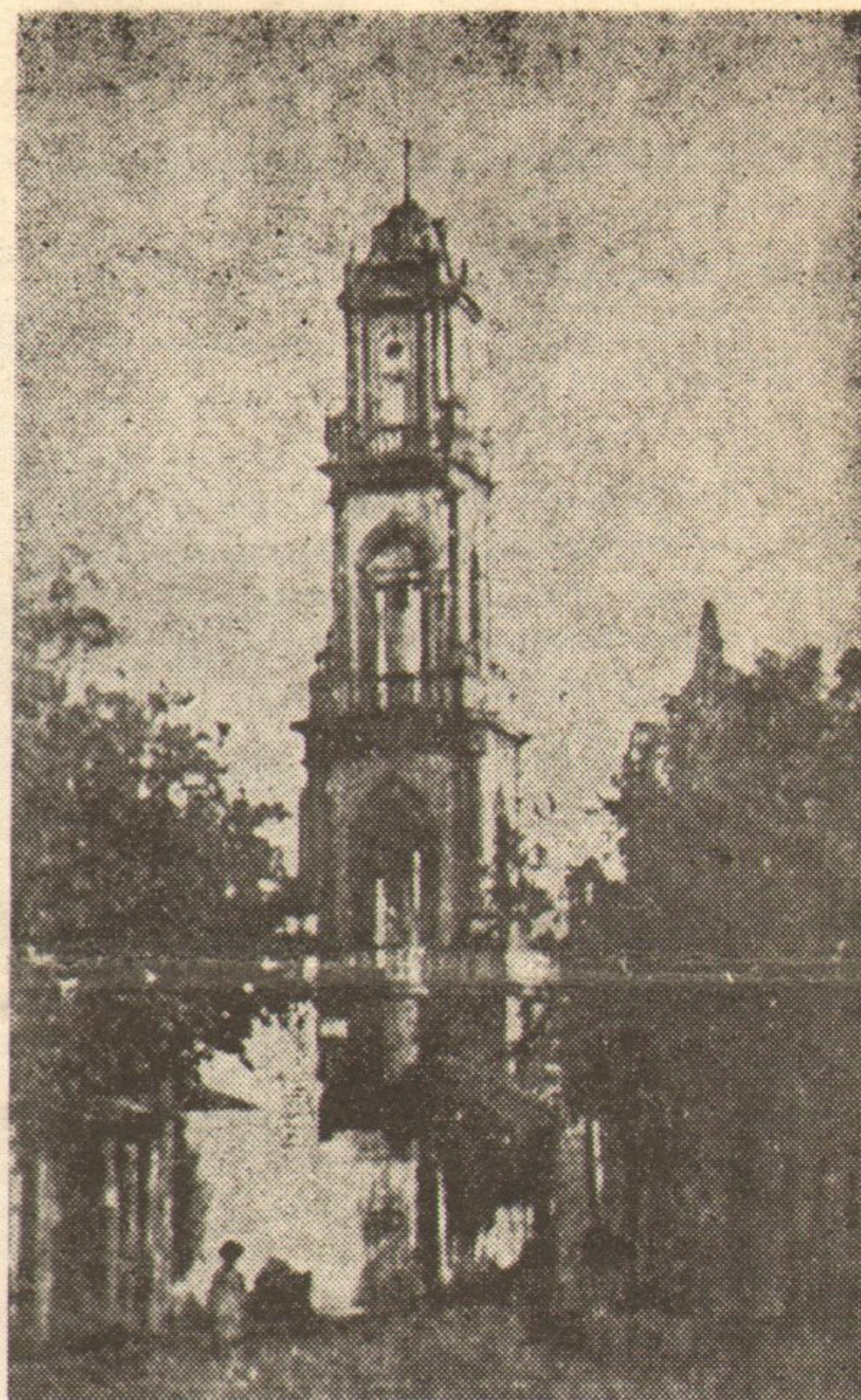
Το καμπαναριό της εκκλησίας της Παναγίας του Μπουρνόβα (1)

Τους τελευταίους καιρούς διατυπώθηκαν σε κάποια δημοσιογραφικά φύλλα, μεμψιμοιρίες για το γεγονός ότι δεν πήρε μια επίσημη κι αναμνηστικά έορταστική μορφή, το μεγάλο αλλά και θλιβερό ιστορικό γεγονός ότι έδω και πενήντα χρόνια, αντίκρυ, στις άκτες της Ίωνίας, ξετυλίχθηκε το μέγα δράμα της Μικρασιατικής Καταστροφής. Πώς γιορτάσαμε τόσο επίσημα και λαμπρά το 1821; Έτσι έπρεπε να θυμηθούμε κι εκείνη την έθνική συμφορά! Μά είναι δλοφάνερο πώς οι μεμψιμοιρίες αυτές έχουν ένα σχήμα δξύμωρο. Δεν ακούστηκε ποτέ οι λαοί να «γιορτάζουν» τις έθνικές τους συμφορές με τον τρόπο, τον τόνο και το ύφος που επικαλούνται τους έθνικούς των θριάμβους! Όπως θα λέγαμε, απλά, άλλο γάμος και άλλο κηδεία! Δεν ήταν λοιπόν ούτε λογικό μά ούτε και σκόπιμο, να δοθεί επίσημη έμφαση σ' εκείνη την καταστροφή. Όμως, αυτή ή αδήρητη λογική αναγκαιότητα, δεν έμπόδισε καθόλου τον έλληνισμό, και ιδίως τον μεταφυτευμένο στην έλευθερη Ελλάδα μικρασιατικό έλληνισμό και τους απογόνους του, να άναδαυλίσουν μέσα τους με ίερή κατάνυξη εκείνο το «πάθος», εκείνο το «πένθος» και να το ξαναζήσουν έντονα, με διάφορες έκδηλώσεις, που σκοπό δεν είχαν να χυθούν καινούργια δάκρυα για ό,τι τότε χάθηκε μέσα στην άβυσο της καταστροφής, μά για να έπιτευχθεί μια ζωντανή έπανασύνδεση με τις «χαμένες πατρίδες».