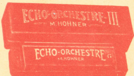
Ὀρχήστρα Νο 3 - Δραχ. 120