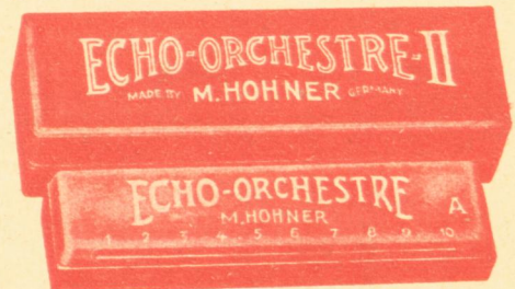
Ὀρχήστρα Νο 2 - Δραχ. 100