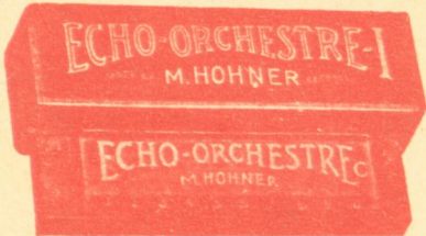
Ὀρχήστρα Νο 1 - Δραχ. 60

ὑπάρχουν εἰς ὅλους τοὺς τόπους καὶ κλίμακας Μικτόρε ἢ Μιγρόρε. Ἀθαναχουῦ τοῦ Κόσμου ὑφίστανται πικιδικαὶ ὀρχήστρα φουαρμόνικαὶν "ΟΡΧΗΣΤΡΑ"