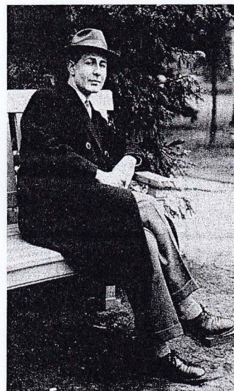
Ο συνθέτης Γιάννης Κωνσταντινίδης.

Κωνσταντινίδης, Γιάννης (Σμύρνη, 1903 - Αθήνα, 1984). Συνθέτης. Γόνος εύπορης αστικής οικογένειας